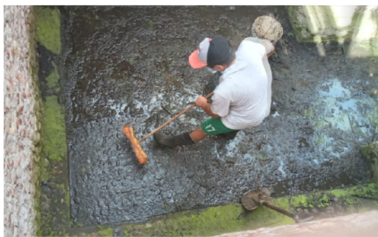
Schoonmaakwerkzaamheden in het waterbasin.