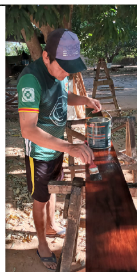
Schaaf- en schilderwerkzaamheden van het ruw aangeleverde hout voor het deksel van het grote waterbasin.