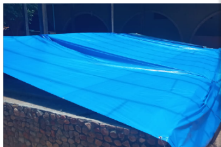
Het weer strak getrokken zeil dat er voor zorgt dat het basin schoon blijft.