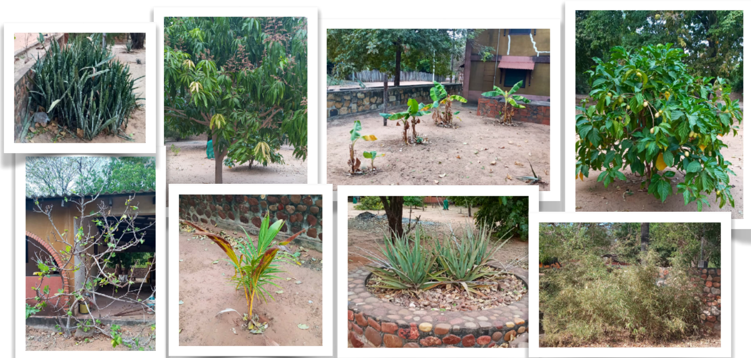
Een paar boompjes die An in 2023 heeft geplant.

Boven, vlnr: Vrouwentongen, nieuwe Mangoboom die An heeft geplant heeft vrucht gedragen, Bananenplanten hebben het wat moeilijk, Noniplant ook door An geplant en draagt ook vruchten.