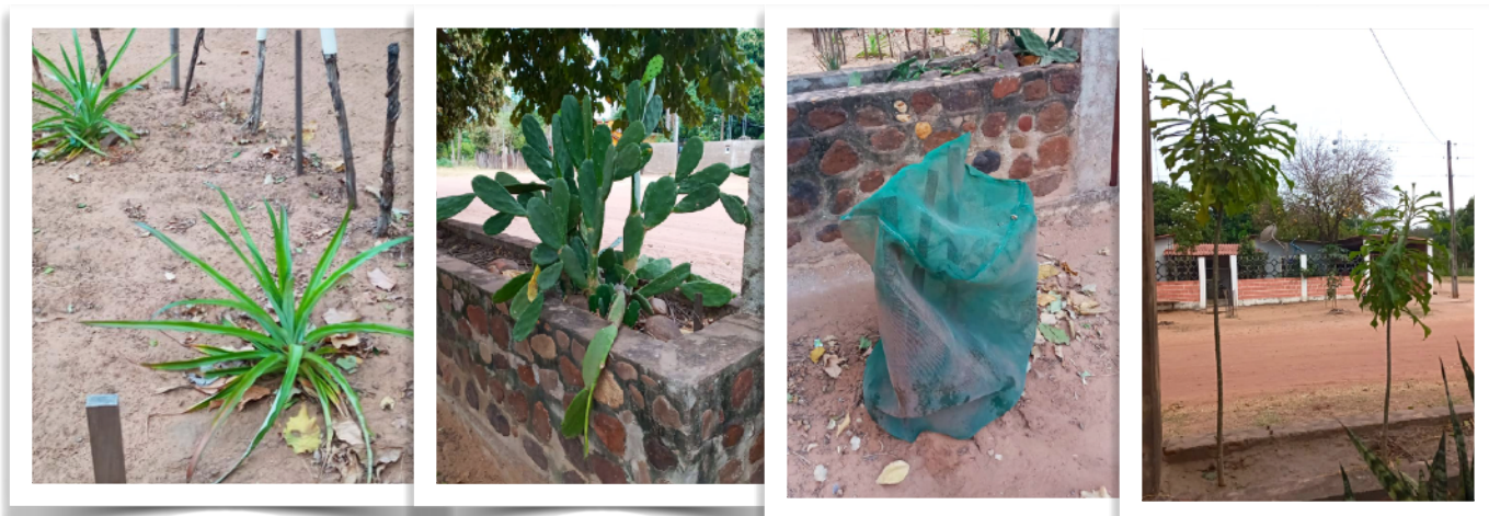
Ananas in de proeftuin.

We zitten in de wat koudere maanden in Bolivia in de provincie Santa Cruz. Waar El Carmen ligt is het minder koud dan in de hoger gelegen gebied zoals La Paz. 's Nachts en in de ochtend kan het dan wel wat kouder zijn in El Carmen maar in de middag kunnen de temperaturen weer op lopen tot zo'n 20 tot 25 graden Celsius. In de tuin staan de meeste bloemen en planten nu dan ook niet in zijn volle glorie.. toch even wat foto's om een indruk te geven.